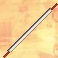
Intégré en toiture