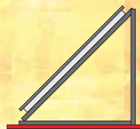
Sur toit plat / Posé au sol

Sous réserve de modifications. www.delalay.ch